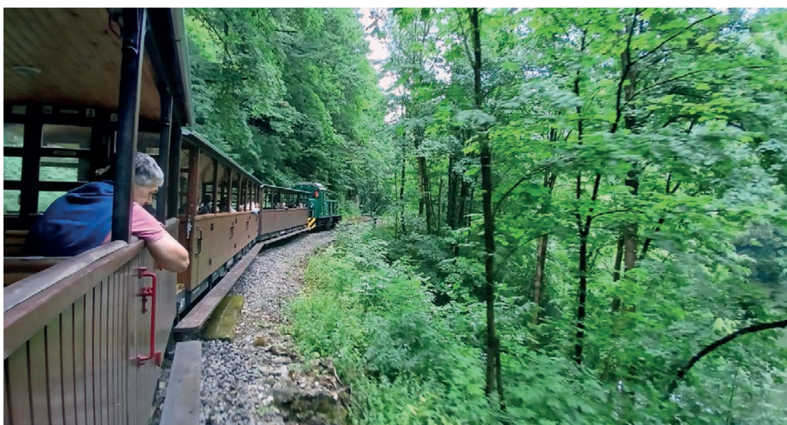
Tunnelmallinen metsäjuna kolkuttelee Miskolcin ja Garadnan kylän väliä useita kertoja päivässä. Lillafüred on sopivasti reitin puolivälissä ja asema melkein linnahotellin takapihalla.