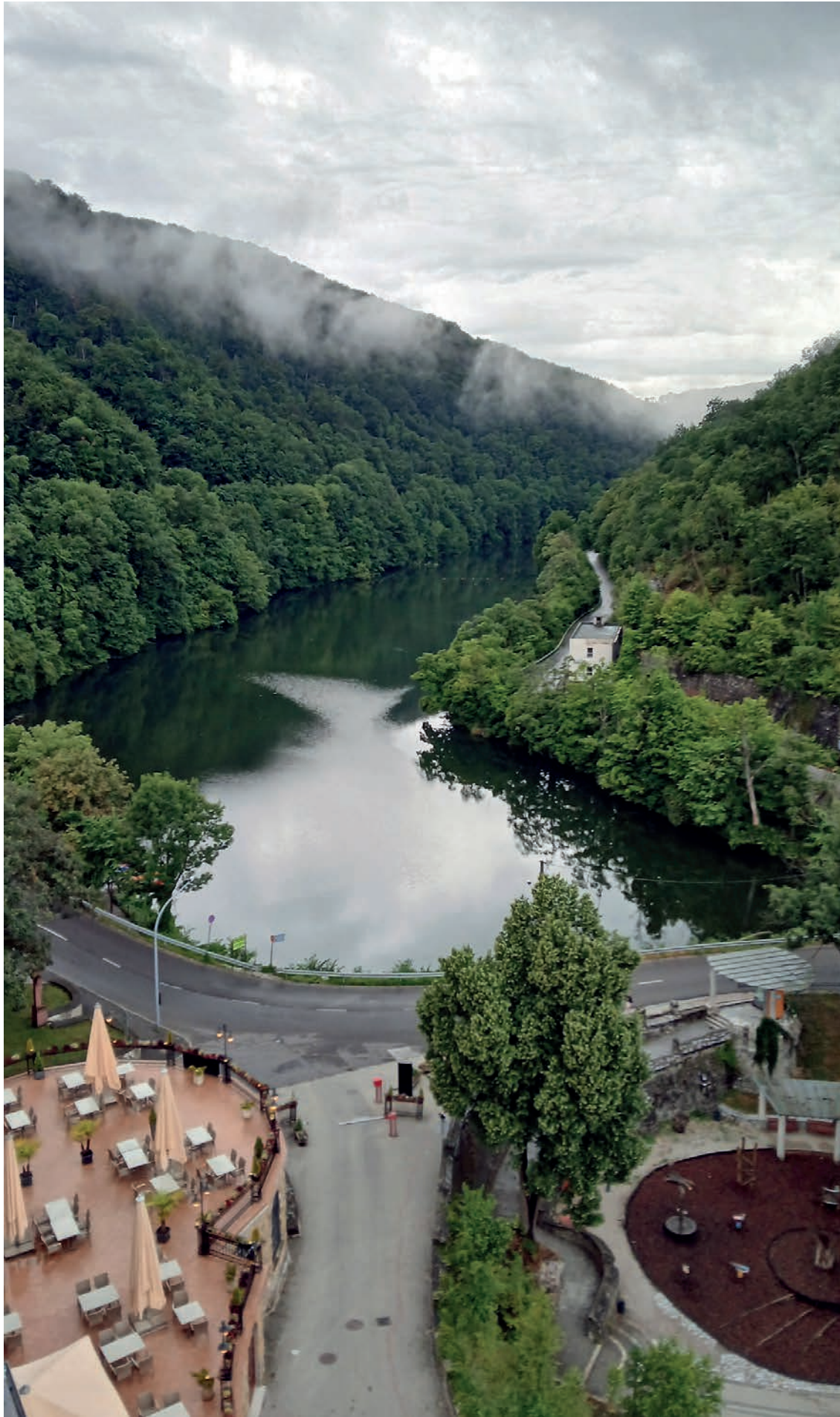
Maisema linnan tornista.

Seuraavaksi suunnattiin kohti monelle seuramme jäsenille tuttua Miskolcia. Täältä alkaa Pohjois-Unkarin vuoristo (Északi-középhegység) eli kukkulamaasto. Heti kun Miskolcin taajama-alue päättyy, maantie muuttuu mutkaiseksi vuoristotieksi, joka kiemurtelee rinteiden ja sankkojen metsien välissä laakson pohjalla. Tie nousee hiljalleen ylöspäin: en-