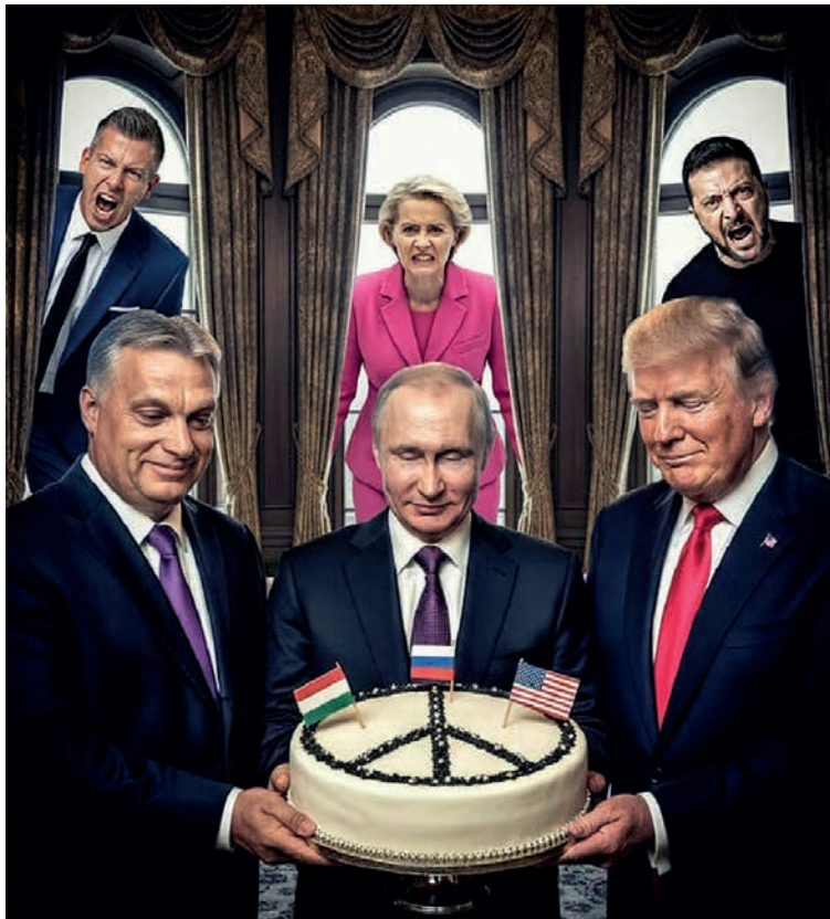
Tekoälyn generoima kuva Unkarin hallituksen läheisistä medioista.