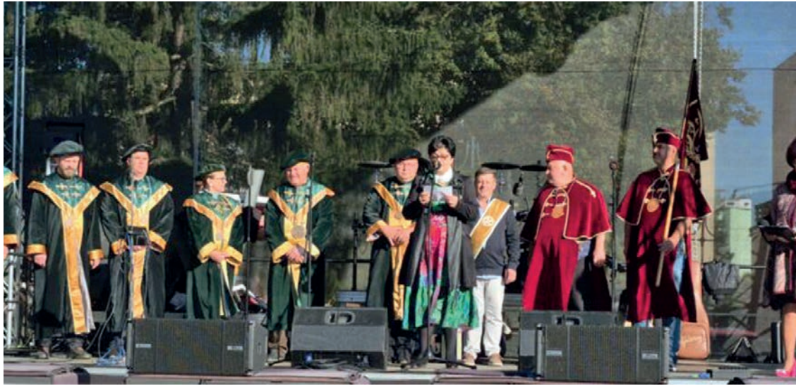
Tarinan pälinkan makua ei Tornaljan pälinkaritarikunnan tuomaristo arvioinut.

Olimme valikoineet suuresta eh-dokasjoukosta informantteja op-