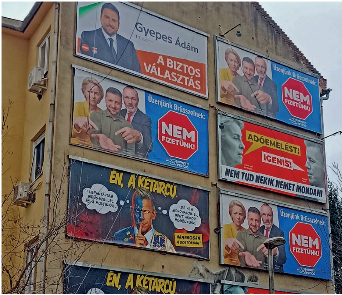
Suuret Fidesz-KDNP:n julisteet hallitsevat politiikan maisemaa myös 2026 vaalikamppailussa.

Vaalit eivät vapaudestaan huolimatta ole Fideszin valtakaudella olleet reilut, eivätkä ole sitä nykyään. Mielipiteitä ohjallaan valtiollisen median sekä poliittisen mainonnan ja sen rajoitusten turvin. Esimerkkinä ovat jo Fideszin tavaramerkiksi muodostuneet propagandajulisteet, jotka jälleen värittävätkin Unkarin katu-kuva. Myös Péter Magyar on ollut jatkuvan mustamaalaus-kampanjan kohteena siitä lähtien, kun