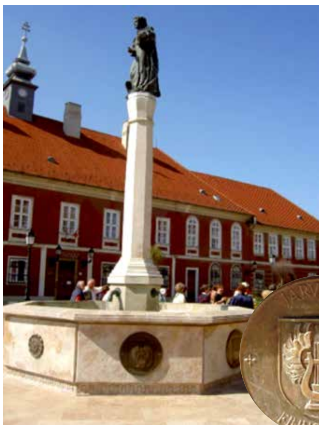
Ystävyyskaupunkien vaakunat suihkulähteen laidalla.

taivutettu uuteen asentoon. Tätä unkarilaisen yhteiskunnan rapiota ja nopeaa vajoamista yhä kauemmas länsimaisen liberaalin demokratian periaatteista, on syystäkin muualla Euroopassa seurattu huolestuneina viime vuosina.