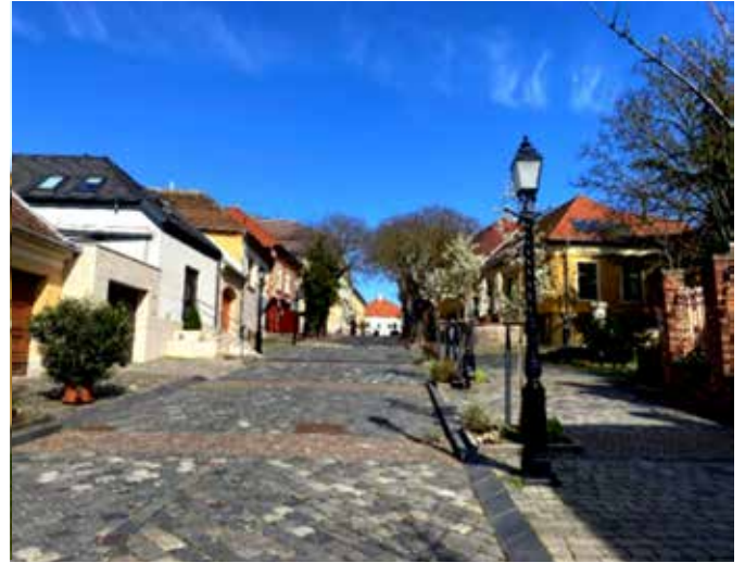
Vácin vanhan kaupungin katunäkymä