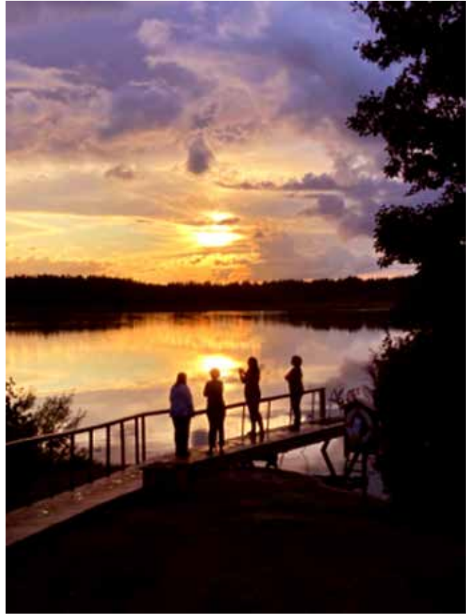
Hieno värikäs auringonlasku kruunasi illan.