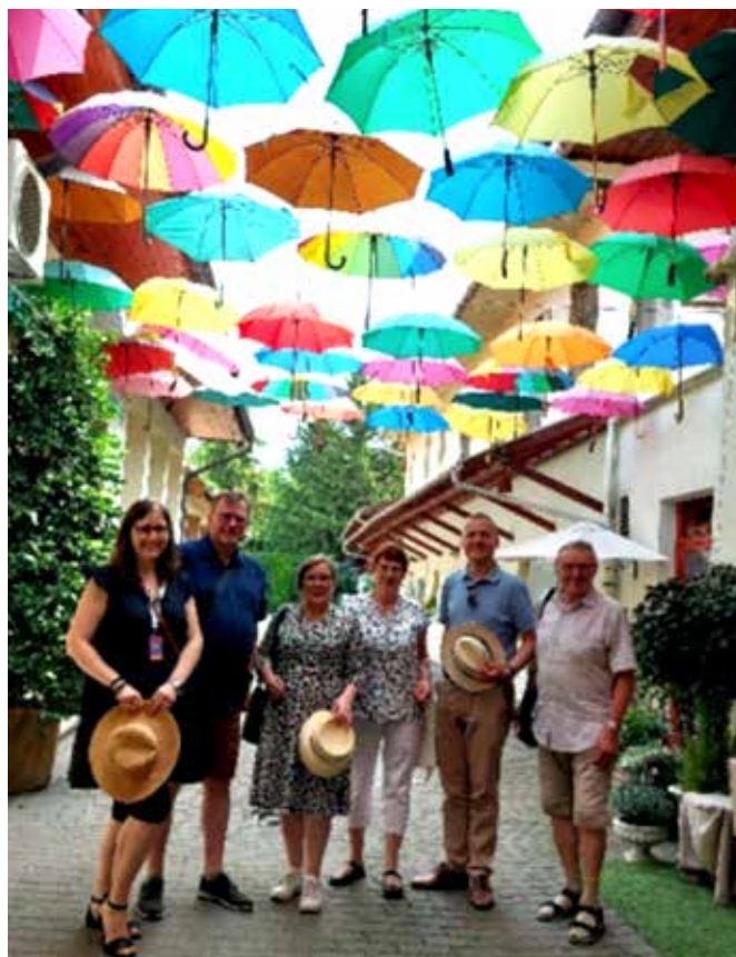
Delegaatio ja tulkki päiväkävelyllä

Vácin kaupungin kolmeksi päiväksi vallannut Vigalom ta-