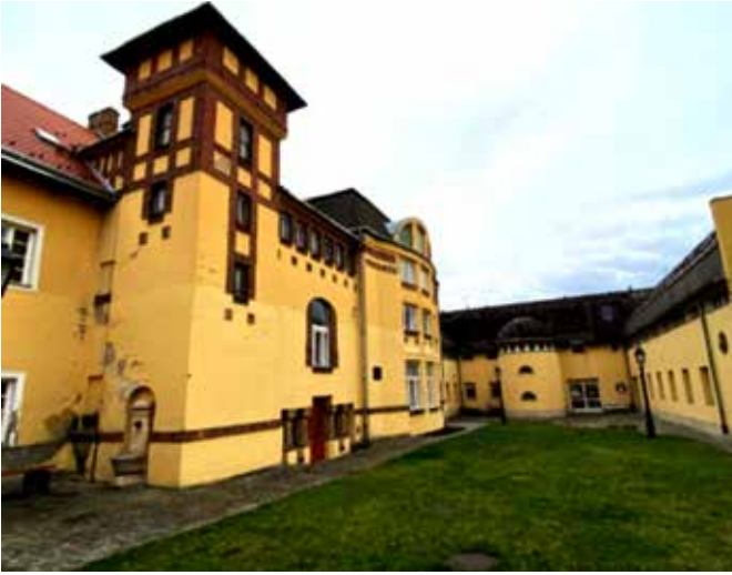
Kaupungin talon "takapiha"