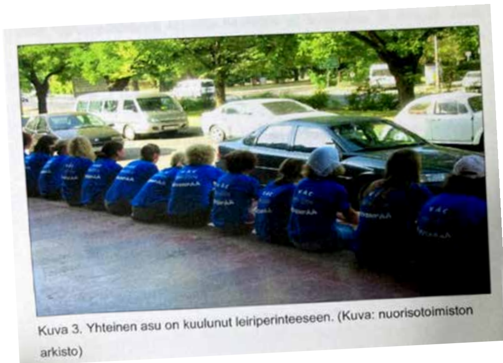
Kuva 3. Yhteinen asu on kuulunut leiriperinteeseen.

Kotkasta matka jatkui halki itäisen Suomen, Joensuun kautta aina Nurmekseen saakka. Bombalta risteilimme halki Pieli- sen ja piipahdimme ihailemassa Suomen kansallismaisemaa Ukko-Kolin huipulta.