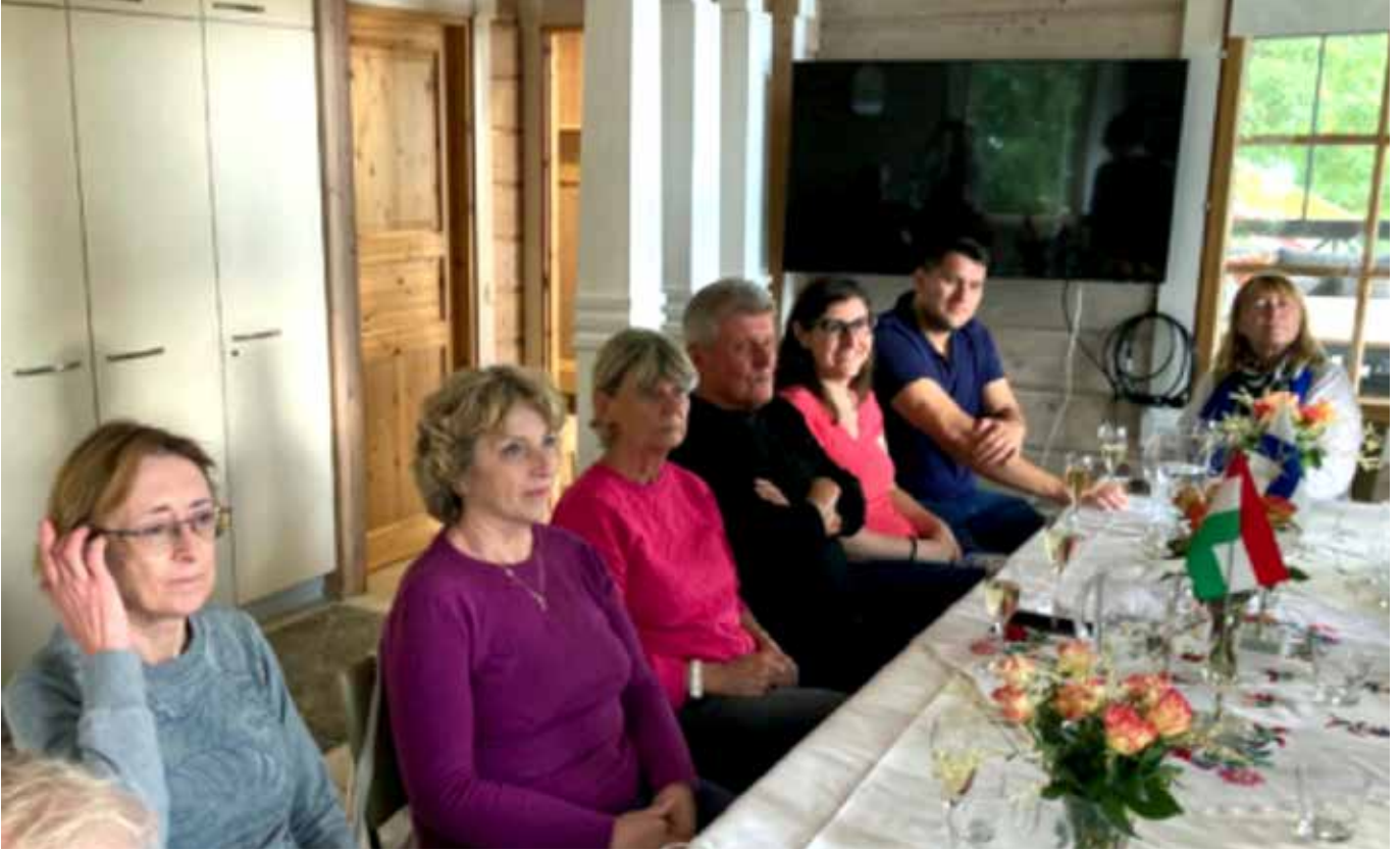
Vácilaisvieraat illanvietossa Keudan rantasaunalla.