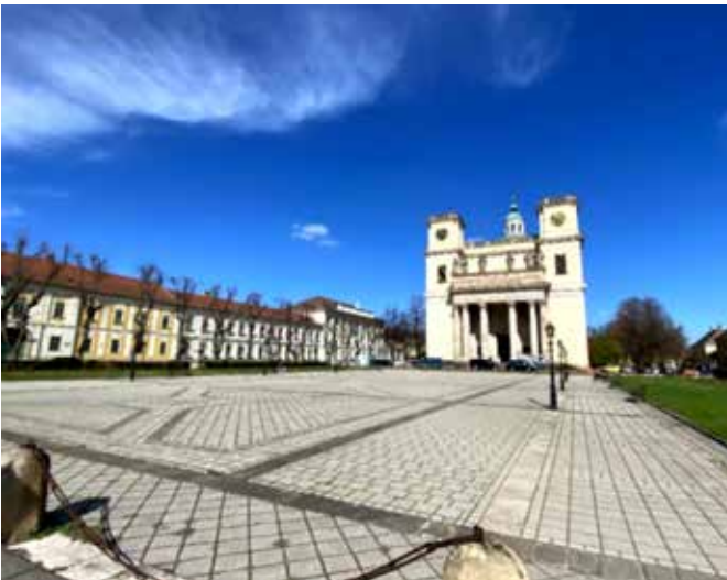
Laajan Konstantin terin taustalla on Assumption Cathedral (Tuomiokirkko)