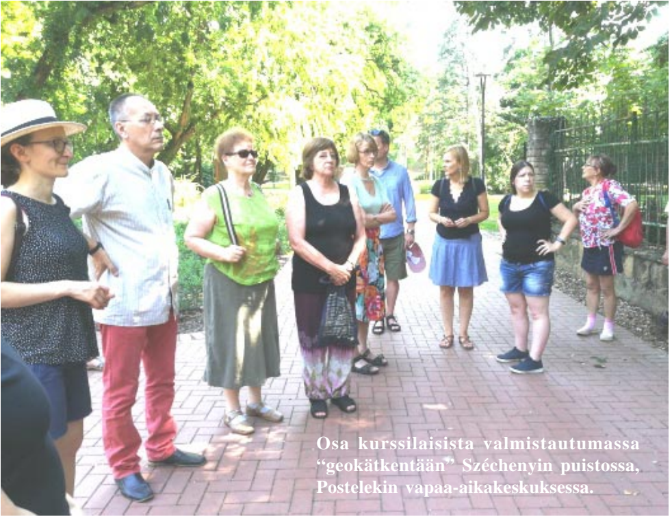
Osa kurssilaisista valmistautumassa "geokätkentään" Széchenyin puistossa, Postelekin vapaa-aikakeskuksessa.

Yllä vasemmalla "kolmen Körös-joen" helteinen risteily on päättymässä, kaikki ovat janoissaan, mutta iloisia. Transilvaniasta tuleva Körös laskee Suurta tasankoa eli Alföldiä halkovaan Tisza-jokeen.